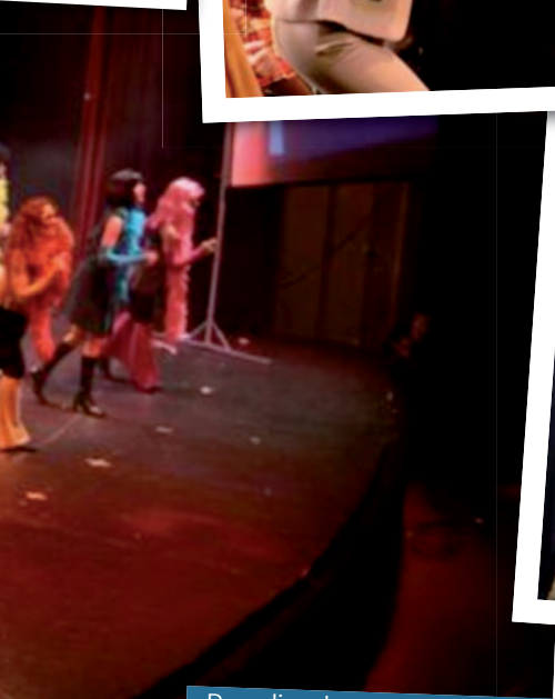
Parodie : les années disco