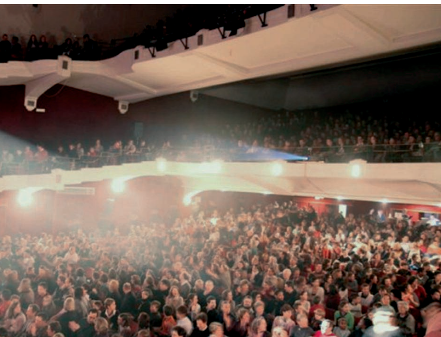
le Théâtre Saint-Michel bondé

de quatre collègues au regard sévère et peu bienveillant, selon le principe de l'humour décalé. Le tout devant un public d'élèves, d'anciens et de parents le plus dynamisé possible !