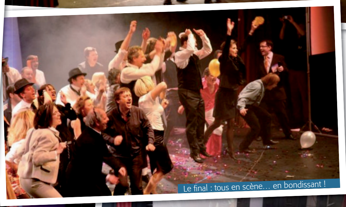
Le final : tous en scène... en bondissant !