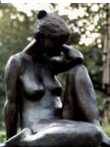
Pascale Square de la Croix-Rouge Ixelles