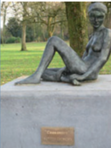
Cassandre Rue François Libert Waterloo