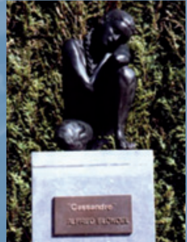
Cassandre Square Louisa Woluwé-Saint-Pierre