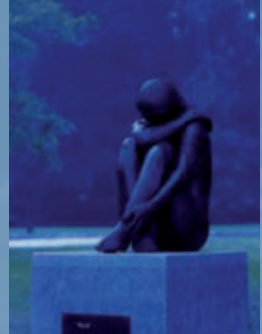
Neli Parc communal de Waterloo Waterloo