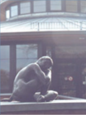
Agnès Avenue Crocq Jette