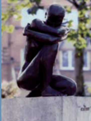
Cathy Place Dumon Woluwé-Saint-Pierre