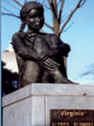
Virginie Rue de Tervet Etterbeek