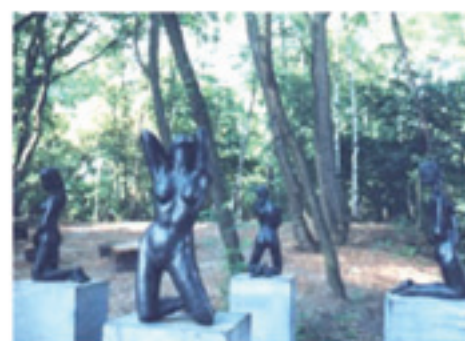
Les quatre saisons Jardin de la source Louvain-la-Neuve